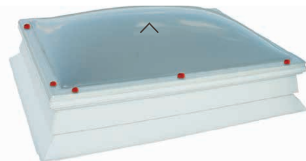
HAGELSTOP, SUPER-TOP, PET-TOP

visoka otpornost na udarce veća otpornost na oštećenja uzrokovana vandalizmom