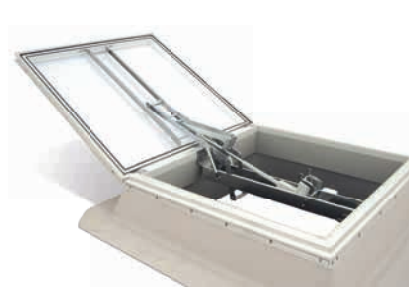
TOP-90 PLUS svjetlosna kupola s 24 V okovom za odvođenje dima i topline, montirana na nastavni vijenac

Napomena: Moguća je naknadna preinaka modela TOP-90 u model TOP-90 PLUS